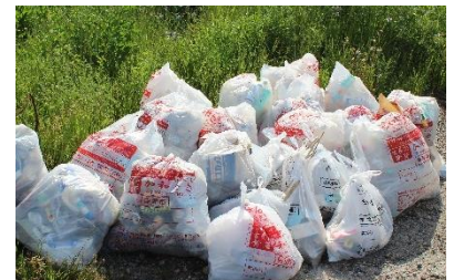
回収したごみは、ごみ袋約20袋になりました。

5月11日（土）に、1～6年生、保護者の皆様、中学生、合わせて約60名が参加し、経田浜のごみを回収しました。さわやかな海風に吹かれてみんなでごみを拾うと海岸がきれいになり、素敵な笑顔が広がりました。