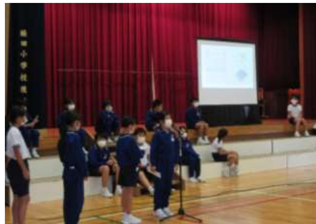
4年生 総合的な学習の時間の発表