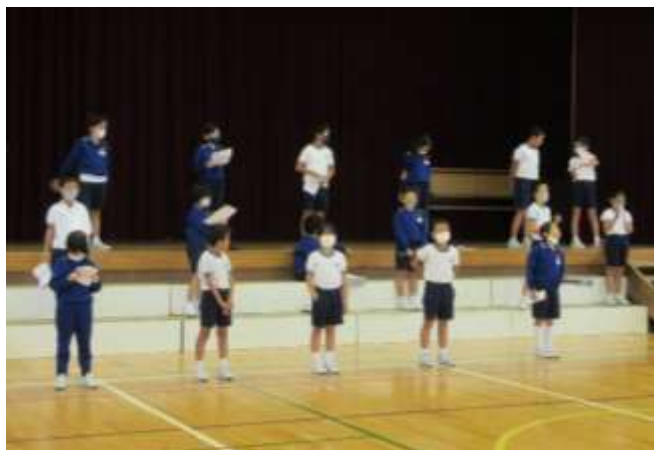
3年生 総合的な学習の時間の発表