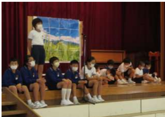
5年生 総合的な学習の時間の発表