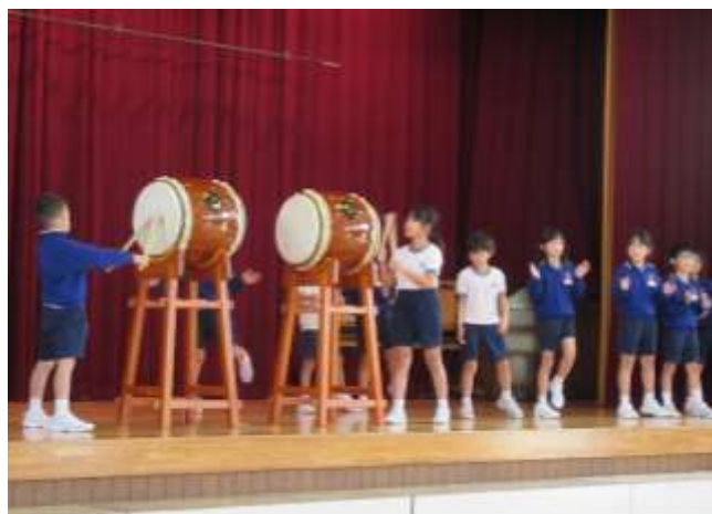
2年生 歌・手遊び・和太鼓演奏